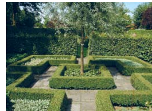
Foto rechts onder: Parterre de broderie in de tuinen van Het Loo. Ook de omzomingen van de bloemperken zijn van Buxus.